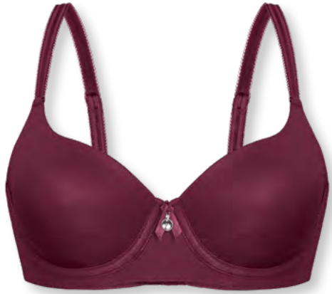
24457 B - E | 75 - 95