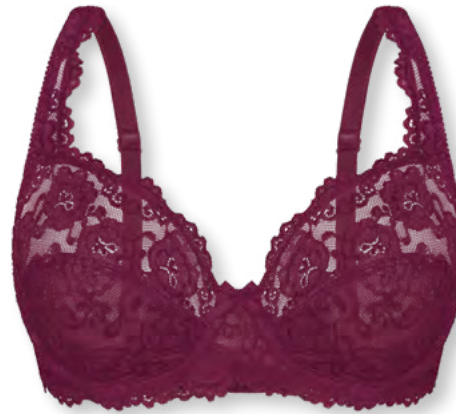
24660 B - E | 75 - 100