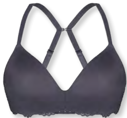
14660 A - C | 70 - 95