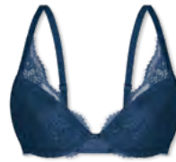
25443 | Schalen-BH / padded bra / SG paddé B-D | 75-95