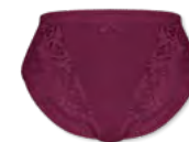
562 | Miederslip / girdle / culotte gainante 36-48