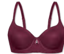
24457 | Schalen-BH / padded bra / SG paddé B-E | 75-95