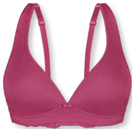
15438 A - C | 70 - 90