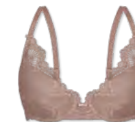
25444 | Schalen-BH / padded bra / SG paddé B-D | 75-95