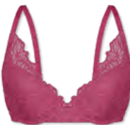
25438 | Schalen-BH / padded bra / SG paddé B-D | 75-95