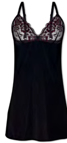
34552 | Négligé/ negligee/ nuisette 36-44