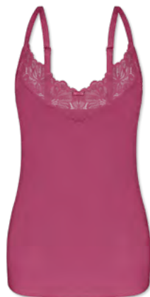
35438 | Top / top 36-44