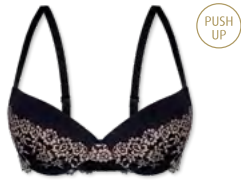
25440 | Push Up-BH / push up bra / SG push up A-C | 70-90