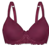
24560 | Spacer-BH / spacer bra / SG spacer B-E | 70-95 | FLEXICUP Cupmaterial / cup material / coupe le materiel: 90% Polyester 10% Elasthan / elastane / élasthanne