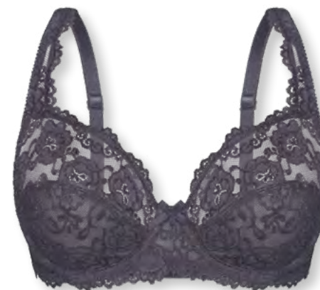
24660 B - E | 75 - 100