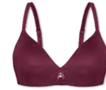
14457 | Soft-BH Einlage / padded soft cup bra / SG paddé sans armatures B-D | 75-95