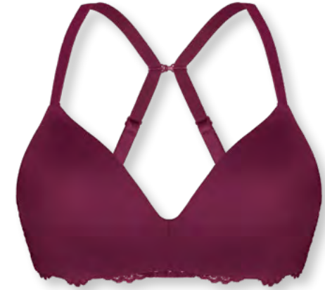
14660 A - C | 70 - 95