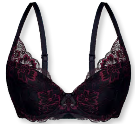
24553 B - D | 75 - 95