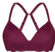
14660 | Soft-BH Einlage / padded soft cup bra / SG paddé sans armatures A-C | 70-95