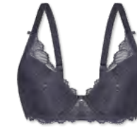
24554 | Schalen-BH / padded bra / SG paddé B-D | 75-95