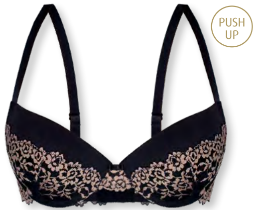
25440 A - C | 70 - 90