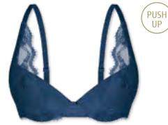
25442 | Push Up-BH / push up bra / SG push up A-C | 70-90