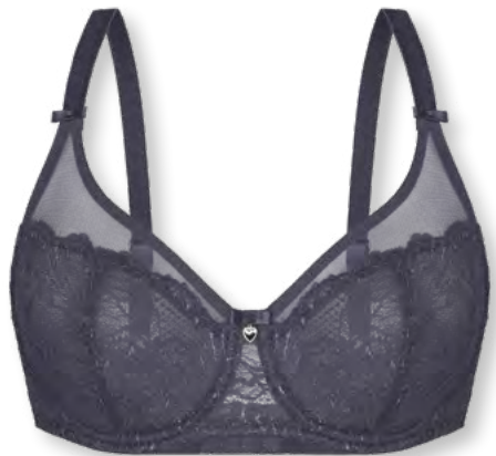
24555 B - E | 75 - 95