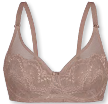
25445 B - E | 75 - 95