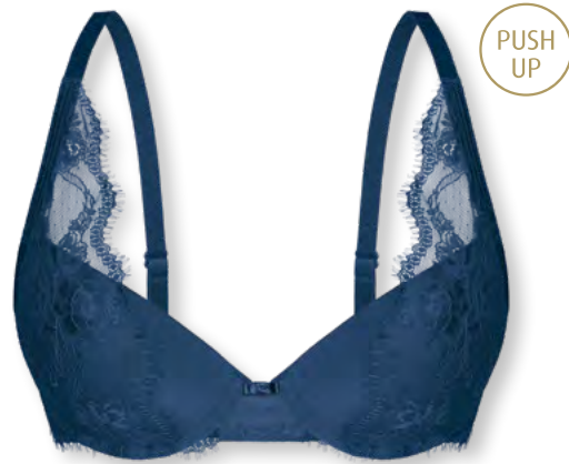
25442 A - C | 70 - 90