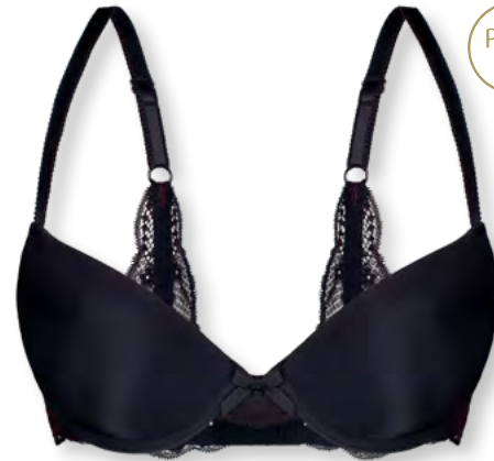
24552 A - C | 70 - 90