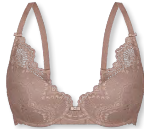
25444 B - D | 75 - 95