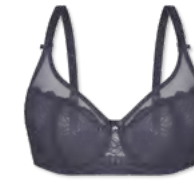
24555 | Bügel-BH / wire bra / SG avec armatures B-E | 75-95