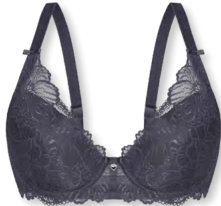
24554 B - D | 75 - 95