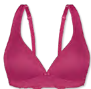
15438 | Soft-BH Einlage / padded soft cup bra / SG paddé sans armatures A-C | 70-90