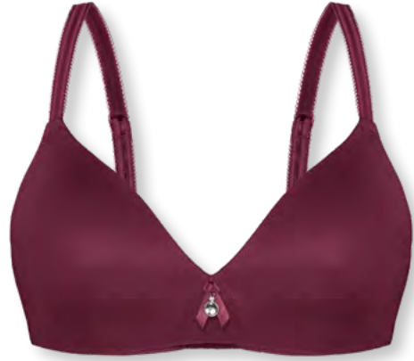
14457 B - D | 75 - 95