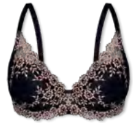
25441 | Schalen-BH / padded bra / SG paddé B-D | 75-95