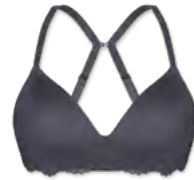
14660 | Soft-BH Einlage / padded soft cup bra / SG paddé sans armatures A-C | 70-95