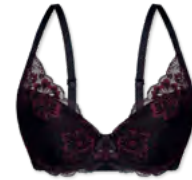
24553 | Schalen-BH / padded bra / SG paddé B-D | 75-95