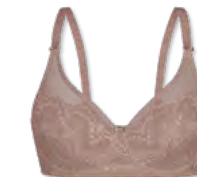
25445 | Bügel-BH / wire bra / SG avec armatures B-E | 75-95