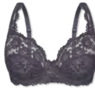
24660 | Bügel-BH / wire bra / SG avec armatures B-E | 75-100