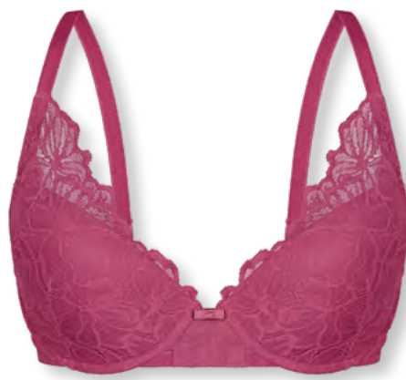
25438 B - D | 75 - 95