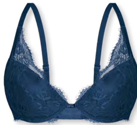
25443 B - D | 75 - 95