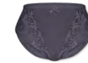
562 | Miederslip / girdle / culotte gainante 36-48

Grundware / main material / matériel de base: 86% Polyamid / polyamide 14% Elasthan / elastane / élasthanne Spitze / lace / dentelle: 88% Polyamid / polyamide 12% Elasthan / elastane / élasthanne Tüll / Tulle: 90% Polyamid / polyamide 10% Elasthan / elastane / élasthanne Futter / lining / doublure: 100% Polyamid / polyamide