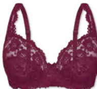
24660 | Bügel-BH / wire bra / SG avec armatures B-E | 75-100