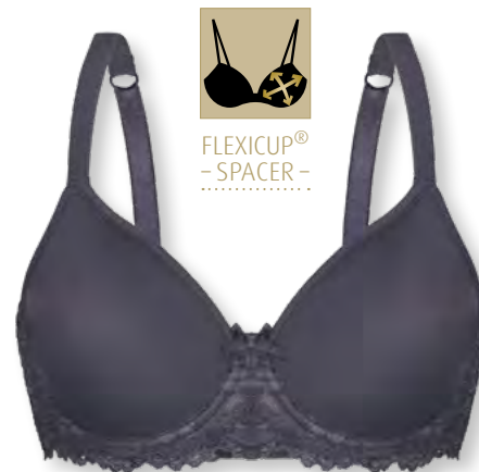
24560 B - E | 70 - 95