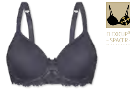
24560 | Spacer-BH / spacer bra / SG spacer B-E | 70-95 | FLEXICUP Cupmaterial / cup material / coupe le materiel: 90% Polyester 10% Elasthan / elastane / élasthanne