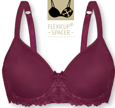
24560 B - E | 70 - 95